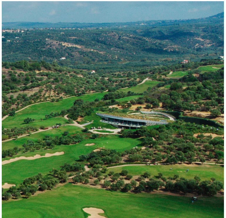
Bay Coursen suunnitellut Robert Trent Jones Jr on suunnitellut viihdyttävän kentän.