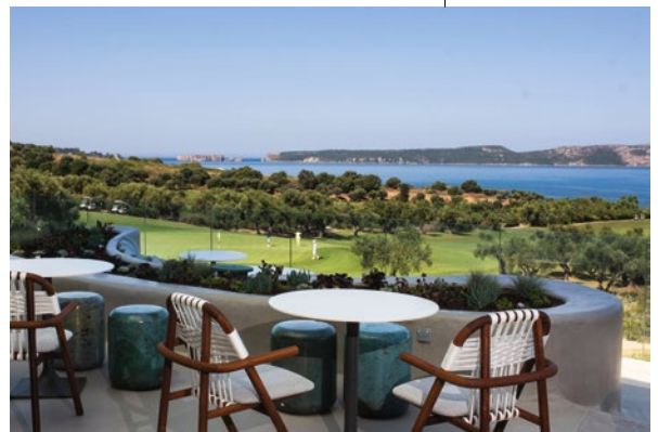
Messeniassa on upeita hiekkarantoja, joiden ansiosta se on suosittu lomakohde. Golf pidetään resortin sesonkia keväisin ja syksyisin.

Maisemat ovat vavahduttavan upeat, joten ei ole ihme, että