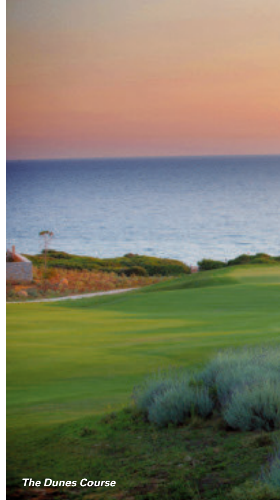
The Dunes Course

Mittelpunkt der Anlage ist das „Agora“, hier fühlt man sich wie in einem Dorfzentrum. Mit Spezialitätenrestaurants, einem griechischen Kaffeehaus, Boutiquen und einem Open-Air Kino. Kulinarische Genüsse bieten auch die eigenständigen Restaurants der Hotels mit internationaler oder griechischer Küche. Mehrere Swimmingpools, Pool- und Lounge-Bars, der tolle Strand mit dem Barbouni Restaurant