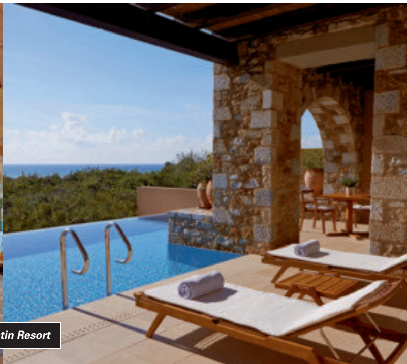
The Westin Resort