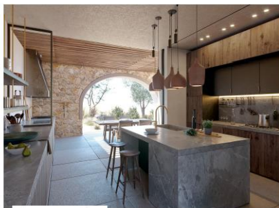
Виды, спроектированные бюро K.studio