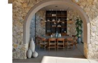
Виды, спроектированные бюро A. N. Tombakos and Associates Architects

В оформлении вилл использованы натуральные материалы, которые идеально вписываются в ландшафт. Широкие оконные проемы позволяют наслаждаться видами на море и горы.