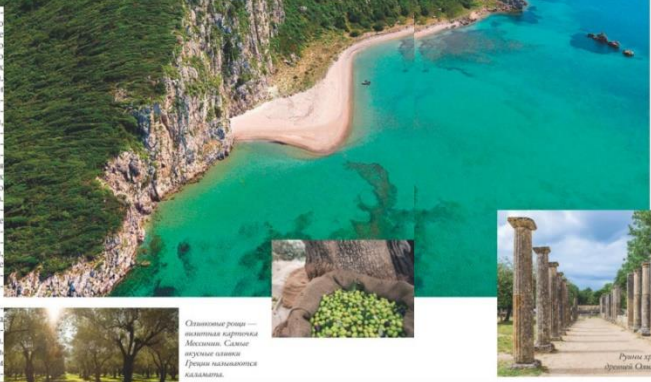
Оливковые рощи — визитная карточка Мессинии. Самые уютные оазисы Греции находятся именно здесь.

Многие заданы путеводителем, но не все знают, что в Греции есть курорты. Но при этом мало кто ориентируется в увлекательных маршрутах материковой Греции. Между тем в юго-западной части Пелопоннесского полуострова находится Мессиния — место удивительной, нетронутой красоты, где бескрайние поля оливковых деревьев спускаются к уютному морскому побережью. Здесь царит расслабленная гостеприимная атмосфера, характерная для южных стран. От аэропорта в Афинах до Мессинии — триста километров. Путь неблизкий, но для меня время пролетело как одно мгновение — в основном благодаря попутному современному автобусу, который ведет вплоть до Каламат, столицы Мессинии. Оттуда еще тридцать километров по проселочным дорогам — и в излучине добрались до курорта Costa Navarino.