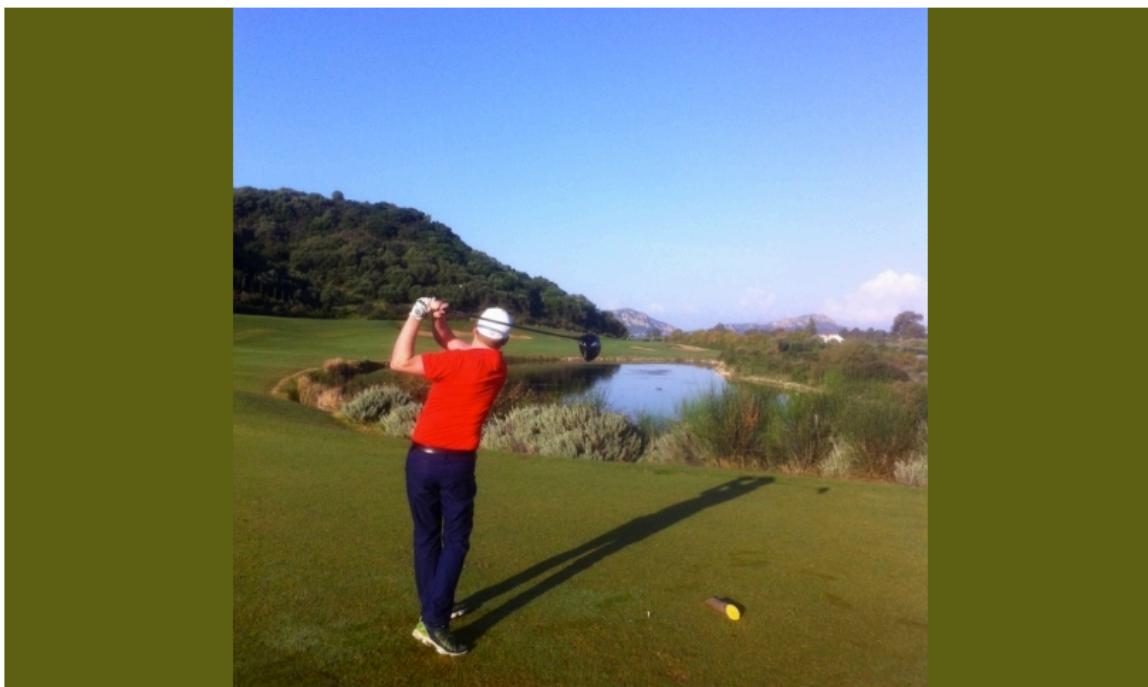
The Bay, départ du 1

Situé à dix minutes des Hôtels Westin et The Romanos , et relié par une navette qui part toutes les trente minutes du club-house de « The Dunes », je ne saurais trop vous conseiller de commencer votre découverte golfique des lieux par le parcours « The Bay » dessiné par Robert Trent Jones Jr . On pourrait même dire sculpté , tant l'effet est ici impressionnant.