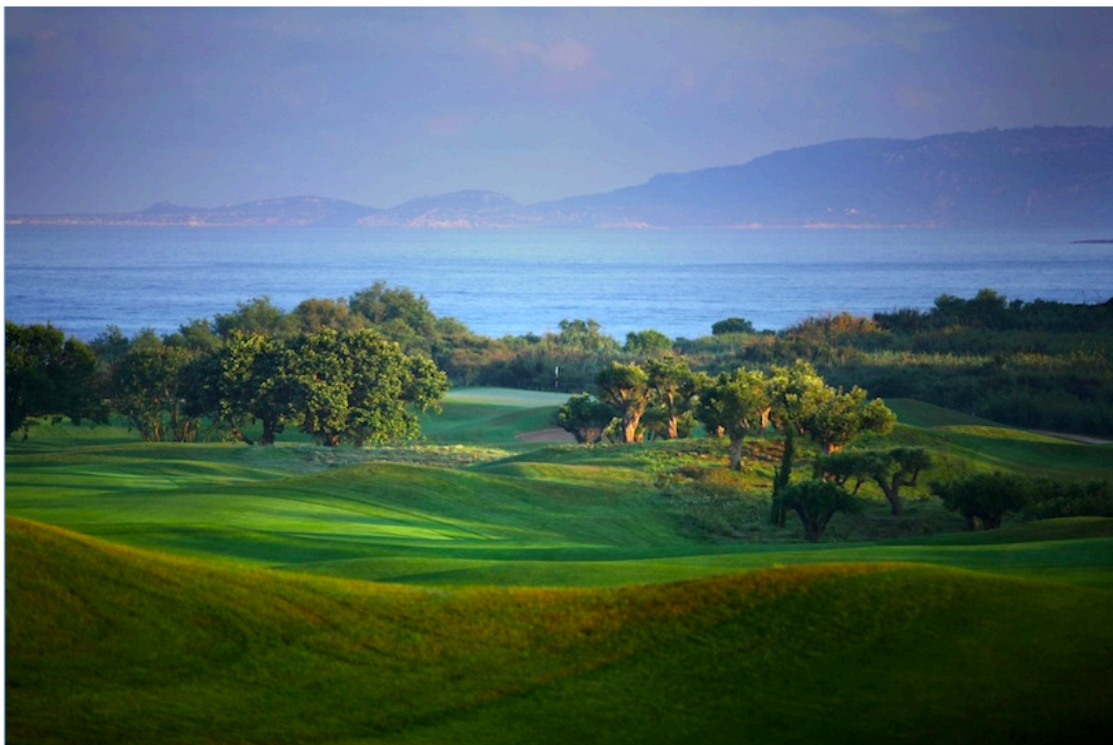
Costa Navarino, entre oliviers et mer

En arrivant à Costa Navarino on est tout de suite impressionné par la beauté sauvage des paysages de la Messénie , cette région du sud-ouest du Péloponnèse . Avoir créé deux parcours de golf en ces lieux, tout en prenant garde de sauvegarder la nature par un programme de développement durable , relevait du défi. Le pari est plus que réussi.