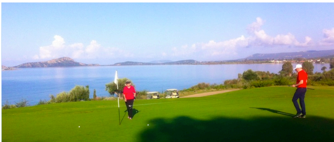
Le green du 4 de The Bay borde la mer Ionienne

Dans un premier temps « The Bay » vous offre un spectacle visuel hors du commun et non dénué d'attrait golfique. A commencer par le 1 « fantastique trou de départ ! » selon Bernhard Langer lui-même. Pour le reste, il ne sera question que de successions de paysages aussi divers que somptueux, mêlant vues sur la mer Ionienne et sur les champs d'oliviers ou de citronniers .