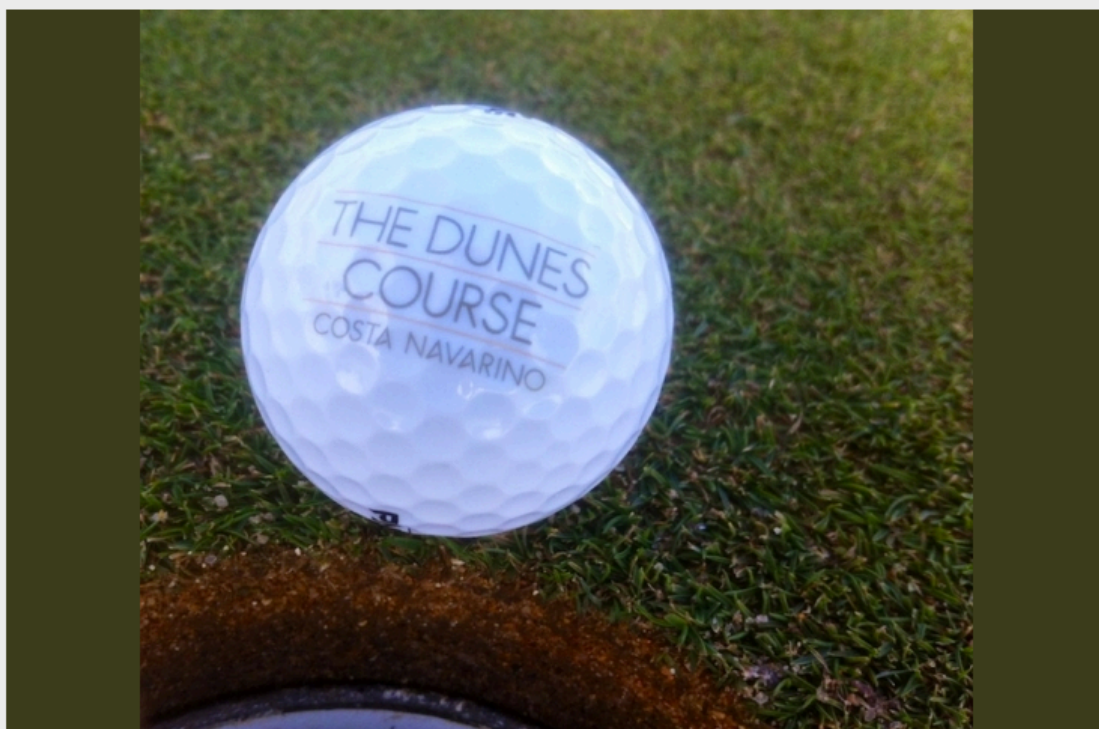
Balle The Dunes