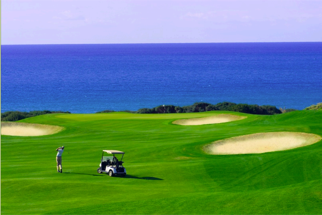
2ème coup sur le 2, le trou signature de The Dunes

Bernhard Langer , associé avec la « European Golf Design », a façonné ici un parcours de golf à la mesure de son palmarès. Le grand champion Allemand, deux fois vainqueur du Masters et, entre autres, vainqueur à cinq reprises de la Ryder Cup dont la dernière fois en 2004 en tant que capitaine de l'équipe européenne, a utilisé toute sa science du jeu pour concevoir un parcours exigeant, se défendant bien, mais très agréable à jouer avec ses larges fairways et où chacun, quelque soit son niveau, y trouvera du plaisir.