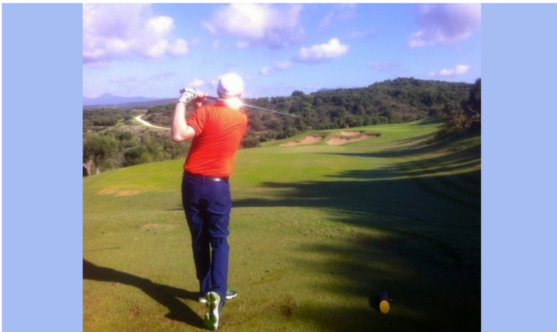
Départ du 9 de The Bay

Sur ce parcours relativement court, par 71 de 5 614 mètres des back-tees, le retour commence par le trou considéré à juste titre comme le plus difficile. Encaissé entre deux barrières végétales, ce par 5 de 488 mètres en montée, au fairway étroit avec un hors limite tout au long sur la droite, se termine par une arrivée compliquée sur un green rapide à double plateau bien défendu et aux pentes loin d'être évidentes à lire. Faire le par sur le 10 de « The Bay » peut satisfaire bon nombre de joueurs ! Une des caractéristiques de ce retour est aussi de proposer trois par 3 dont deux se suivent, les 15ème et 16ème trous. Le 11 est assez court, de 68 mètres pour les dames à 112 mètres pour les bons joueurs, et en descente. Sur ce trou, vous pourrez aisément tester vos capacités au petit jeu !