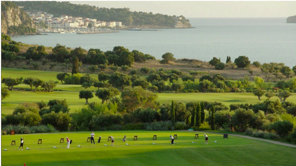
Le practice de The Bay

L'immense club-house construit à partir des pierres et des bois de la région respecte le style traditionnel des constructions locales et fait la part belle aux grandes ouvertures vers la mer ionienne . Avec ses terrasses surplombant le parcours, son ascenseur, son vaste Pro shop , son restaurant « The Flame », un des très bons restaurants du resort, ce club-house est une des beautés du site. Son non moins luxueux vestiaire mérite aussi vraiment le détour.