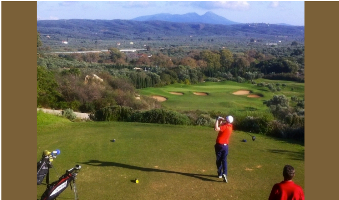
Le départ du 6 de The Dunes

Sur ce golf, bien rythmé, vous serez rapidement dans le bain ; dès le 4 en effet, long par 4 de 443 mètres en léger dogleg gauche, il faut jouer deux très bons coups pour pouvoir toucher en régulation un green bien protégé par de grands et profonds bunkers et lui aussi vallonné et très rapide comme tous les greens du parcours. Changement de décor au départ du 6. N'hésitez pas, là non plus, à sortir votre appareil photo. Certes ce par 4 n'est pas très long, 280 mètres seulement, mais son départ tout en hauteur fait partie de ceux que vous n'oublierez pas de sitôt.