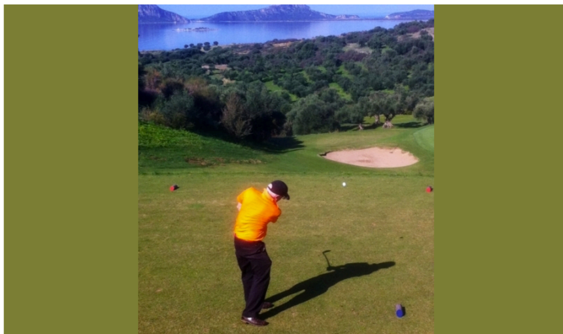
Les seniors sont autorisés à jouer des boules bleues. Ici au départ du 11 de The Bay