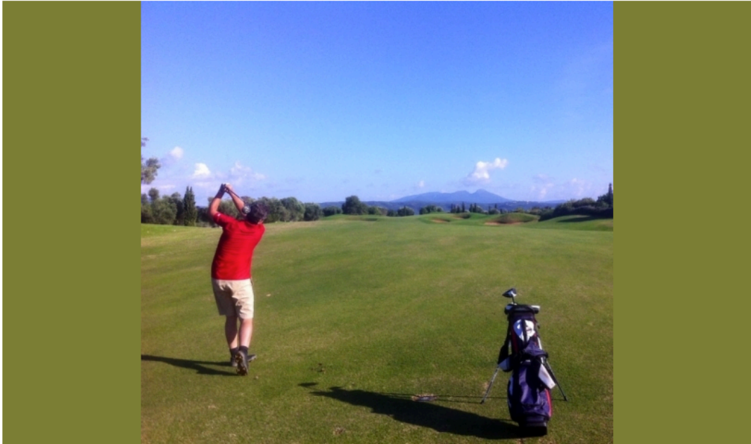
2ème coup sur le 4 de The Dunes

Sur ce golf, bien rythmé, vous serez rapidement dans le bain ; dès le 4 en effet, long par 4 de 443 mètres en léger dogleg gauche, il faut jouer deux très bons coups pour pouvoir toucher en régulation un green bien protégé par de grands et profonds bunkers et lui aussi vallonné et très rapide comme tous les greens du parcours. Changement de décor au départ du 6. N'hésitez pas, là non plus, à sortir votre appareil photo. Certes ce par 4 n'est pas très long, 280 mètres seulement, mais son départ tout en hauteur fait partie de ceux que vous n'oublierez pas de sitôt.