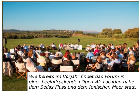
Wie bereits im Vorjahr findet das Forum in einer beeindruckenden Open-Air Location nahe dem Sellas Fluss und dem Ionischen Meer statt.

Messenien / Berlin. Costa Navarino, die nachhaltig entwickelte Premiumdestination in der griechischen Provinz Messenien am südwestlichen Peloponnes, ist im Vorfeld des 'International New York Times Athens Democracy Forum' vom 16.-18. September Schauplatz des „Architecture & Democracy Weekend“. Diese Veranstaltung für geladene Gäste ist die zweite ihrer Art nach dem erfolgreichen „Art & Democracy Weekend“ in 2015, unter der Leitung von Nobelpreisträger Paul Krugmann, dem Künstler Jeff Koons und Serge Schmemann, Mitglied der Redaktionsleitung der NY Times.